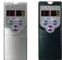
メタリック ブラック