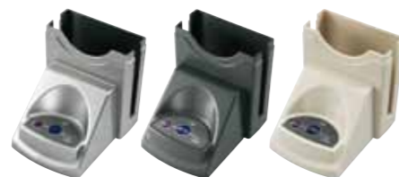
メタリック ブラウンアッシュ アイボリー