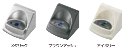
メタリック ブラウンアッシュ アイボリー