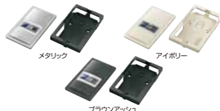
メタリック アイボリー ブラウンアッシュ